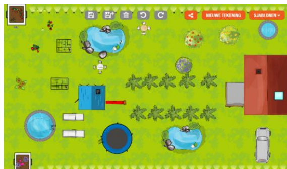
Tuinontwerp van een droomtuin in het ontwerpprogramma van Gardena.

Dit blok hebben de toptalentleerlingen gewerkt aan het thema 'Tuinsafari'. Gedurende het blok verschoven de lessen voor de meeste leerlingen van online naar fysiek. De toptalenten hebben het thema als actueel ervaren. Ze konden goed hun creativiteit erin kwijt en de resultaten waren uiteenlopend. Hieronder ziet u voorbeelden van enkele prachtige resultaten: