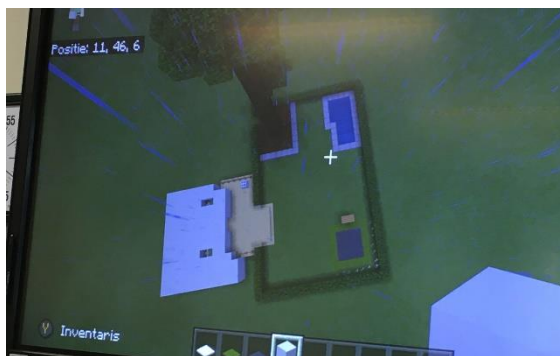
Tuinontwerp in Minecraft.