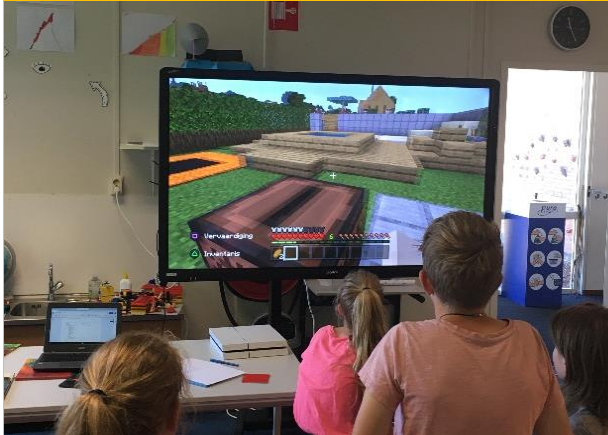
Presentatie van een droomtuin