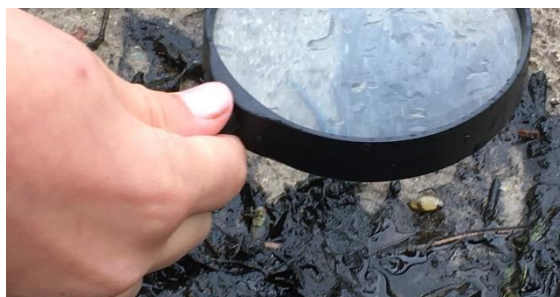
Met de loop op onderzoek uit.