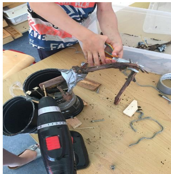
Het bouwen van een insectentuin/hotel.