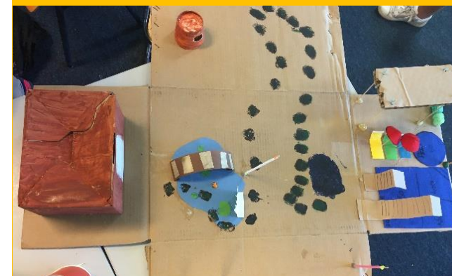
Een droomtuin met blotevoeten pad.