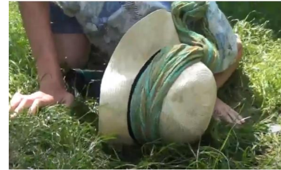
Filofreek met filosofische vragen