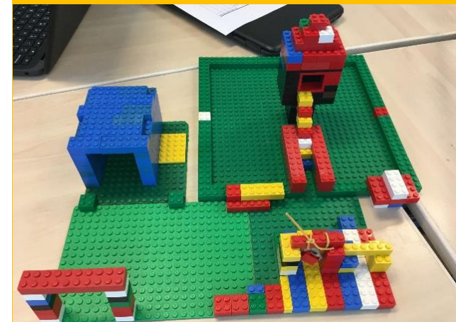
Maquette op schaal van droomschoolplein