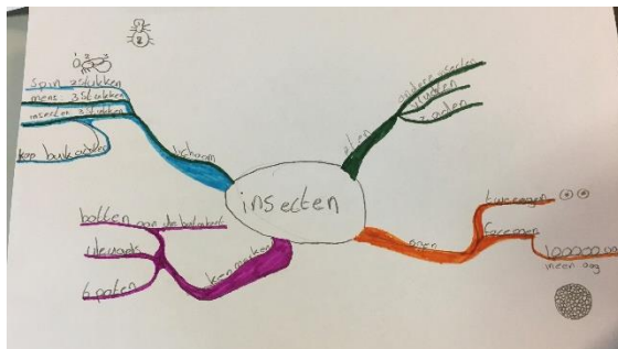
Mindmap na een presentatie over insecten.