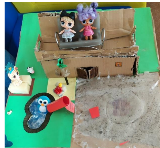
Maquette droomtuin, compleet met zwembad.