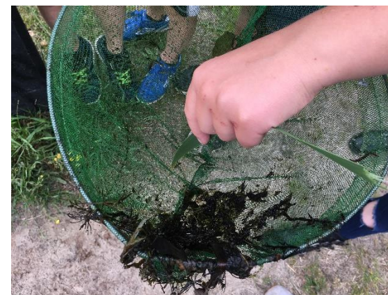
Op onderzoek in de schooltuin en omgeving. Er werden vele waterdieren en insecten gevonden.