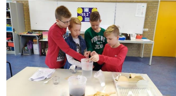
Proefjes met water

tekeningen en briefjes voor hun lootje. Zowel het maken als het krijgen, droeg bij aan een positieve sfeer.