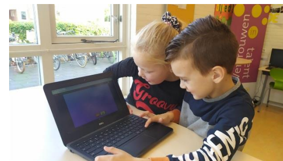
Een game maken met Gamestudio

Toptalenten onderbouw schrijven codes en programmeren elkaar.