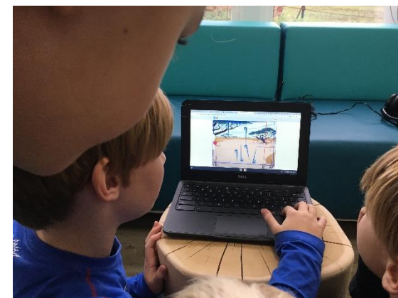
Leerlingen in Oudehorne ontwerpen een game in Scratch.