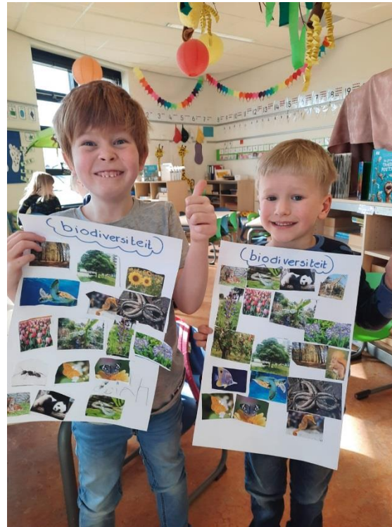
Dorian en Thomas plakten hun associaties met biodiversiteit op.