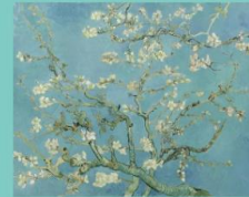
Een presentatie over Van Gogh en een onderzoek naar spechten.