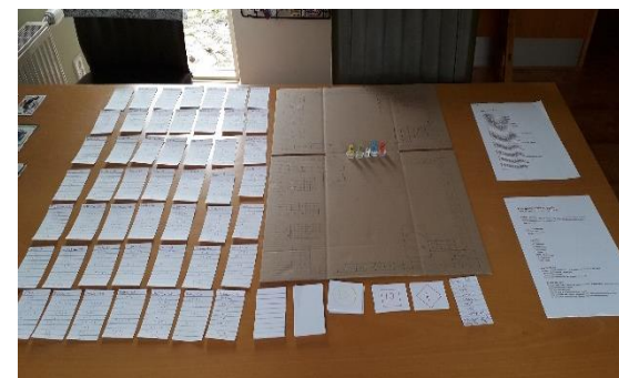
Compleet bordspel over wielrennen.

Natuurlijk maakten de toptalentleerlingen ook een presentatie met theorie en een eindproduct over een onderwerp naar keuze. Ontzettend knap hoe energiek en flexibel leerlingen en ouder(s)/verzorger(s) zich hebben opgesteld in het afronden van het blok. Hieronder ziet u voorbeelden van enkele prachtige resultaten: