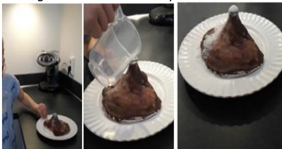
Proefjes over vulkanen